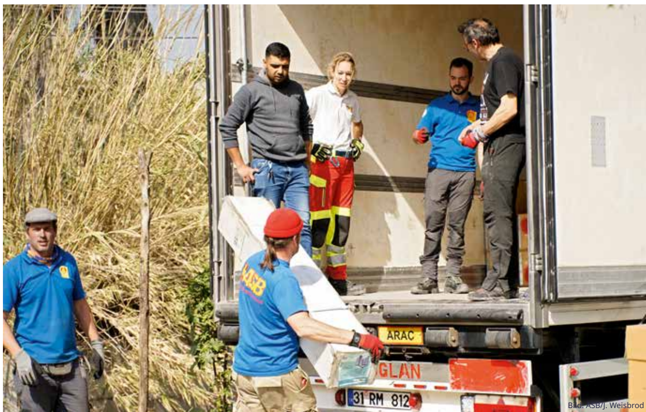
Das Einsatzteam verlädt eine komplett ausgerüstete Zeltambulanz samt Medikamenten für die Hilfsorganisation SEMA (Syrian Expatriate Medical Association). Ziel des Transports ist die syrische Stadt Dschindires.

abgelöst, das die Produktion und Verteilung von Trinkwasser an die Bevölkerung fortsetzte. Zugleich wurden Mitarbeitende des städtischen Wasserversorgers HATSU geschult. Sie übernahmen vor der Heimreise des zweiten Teams den Betrieb der Anlagen, sodass eine nachhaltige Versorgung der Bevölkerung mit sauberem Trinkwasser gesichert ist.