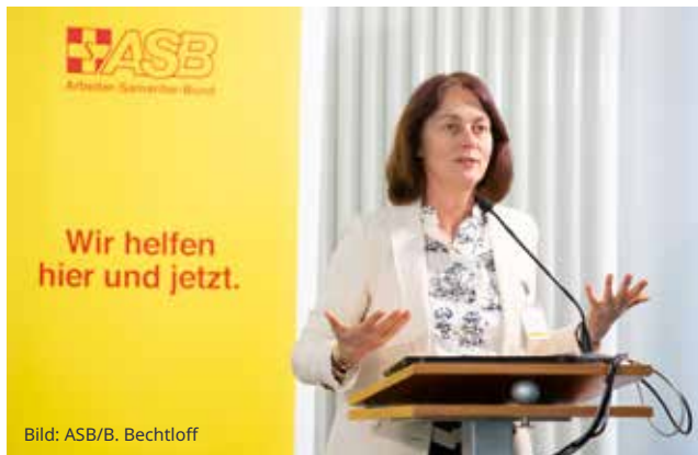
ASB-Präsidentin Dr. Katarina Barley begrüßte die Teilnehmenden im Saal und vor den Bildschirmen.