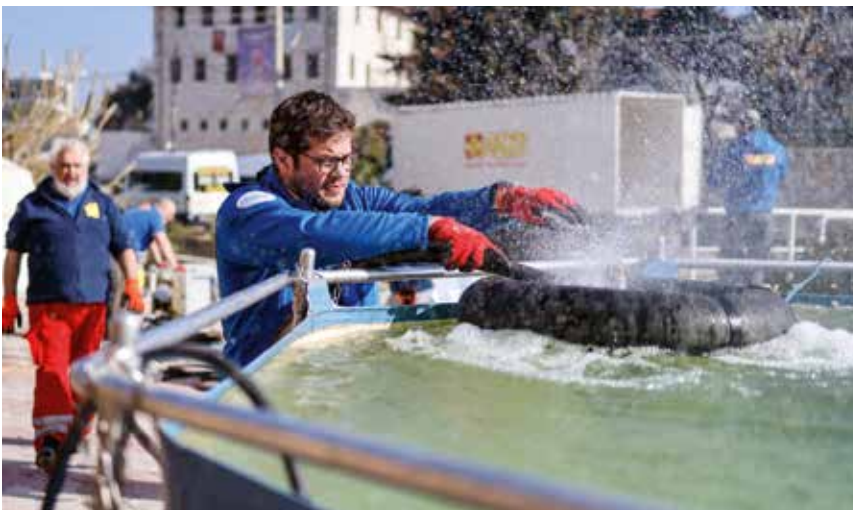
Teamarbeit: Die Ehrenamtlichen des FAST beim Aufbau und Testen der Wasserqualität der mobilen Trinkwasseranlage.

.....> geschult, damit diese optimal eingesetzt werden können. Zukünftig können mehrere Tausend Liter Trinkwasser am Tag produziert und der Bevölkerung im Norden Syriens zugänglich gemacht werden.